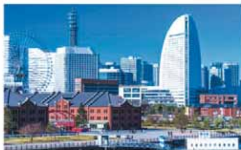
旅行企画・実施:東武観光株式会社

集合・出発 ◇地場産センター第二駐車場 ..... 7:30集合・出発 (足利市朝倉町243-13 労金南側) ◇佐野市勤労者会館東側駐車場 8:00集合・出発 (佐野市文化会館北側)