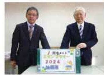
岩澤理事長(右)による 公正な抽選を行いました。

今年度のスタンプラリーの応募数は1,357名でした! たくさんのご応募ありがとうございました。