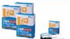
マイレットmini10(災害用)3箱セット